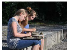
Modellieren im Freien